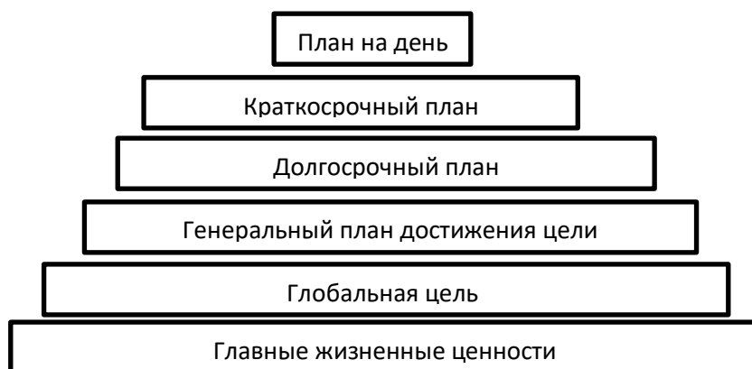
Рисунок – Система Б. Франклина

Система управления временем Бенджамина Франклина основана на базовых принципах классической системы управления временем, которые предусматривают, что любая глобальная задача, стоящая перед человеком, делится на подзадачи, а те в свою очередь – на еще более мелкие подзадачи. Визуально данный процесс можно представить в виде многоступенчатой пирамиды, а применение системы – как процесс поэтапного возведения этой пирамиды.