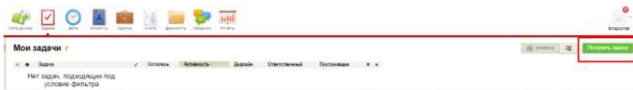
Рисунок 1 –Вкладка «Задачи»

Чтобы создать задачу в системе мегоплан, перейдите – Вкладка «Задачи» - «Поставить задачу» (рис. 1)