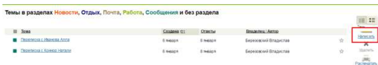
Рисунок 4 – «Написать обсуждение»

Чтобы создать коллективное обсуждение нужно перейти на вкладку «Общение» - «Написать» (рис. 4)