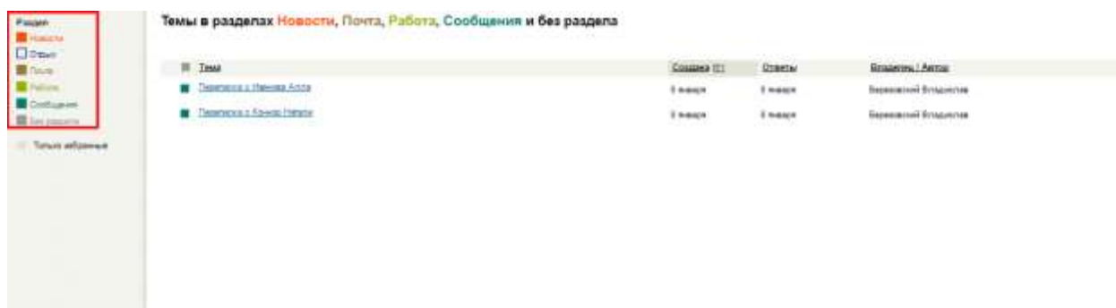
Рисунок 6 – «Фильтр разделов общения»

Все обсуждения можно фильтровать по разделам, выбираю нужные(рис. 6):